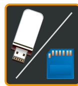
USB & SD